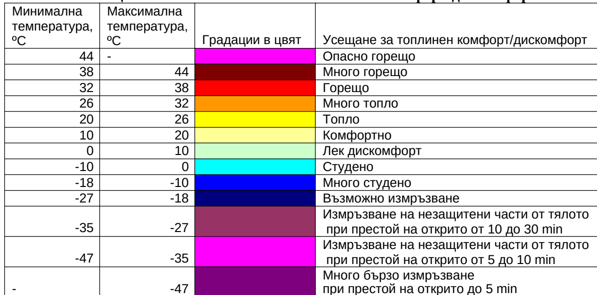
Таблица 1: Скала на степените на топлинен комфорт/дискомфорт

Таблица 1 показва степените на топлинен комфорт/дискомфорт. Категориите за комфортно, топло и горещо са определени на базата на степените на физиологичен стрес, на който е подложена човешката терморегулационна система, при различните температурни условия според температурата на усещане. Категориите за студено следват степените на опасност според Wind Chill Index.